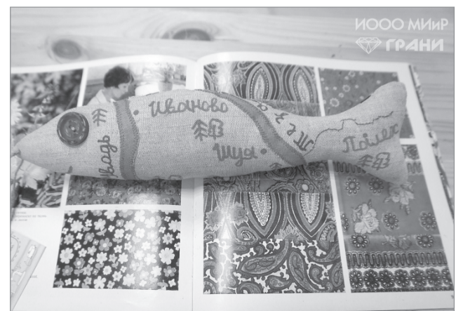
Текстильная рыбка - сувенир для туриста.

Порадуйтесь, пожелайте нам удачи, покажется важным - поддержите!