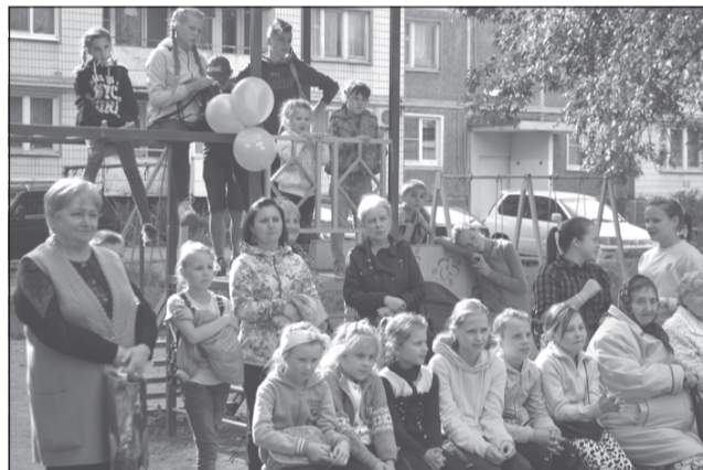
Дружные жильцы дома №18.