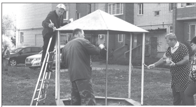
Работа спорится, когда жители трудятся вместе.

В местную общественную приемную поступило обращение от жителей д. № 6, 6а, 8 по ул. Большой Московской об оказании помощи в покраске детской площадки (качелей, лавочек, горки) и окосу территории.