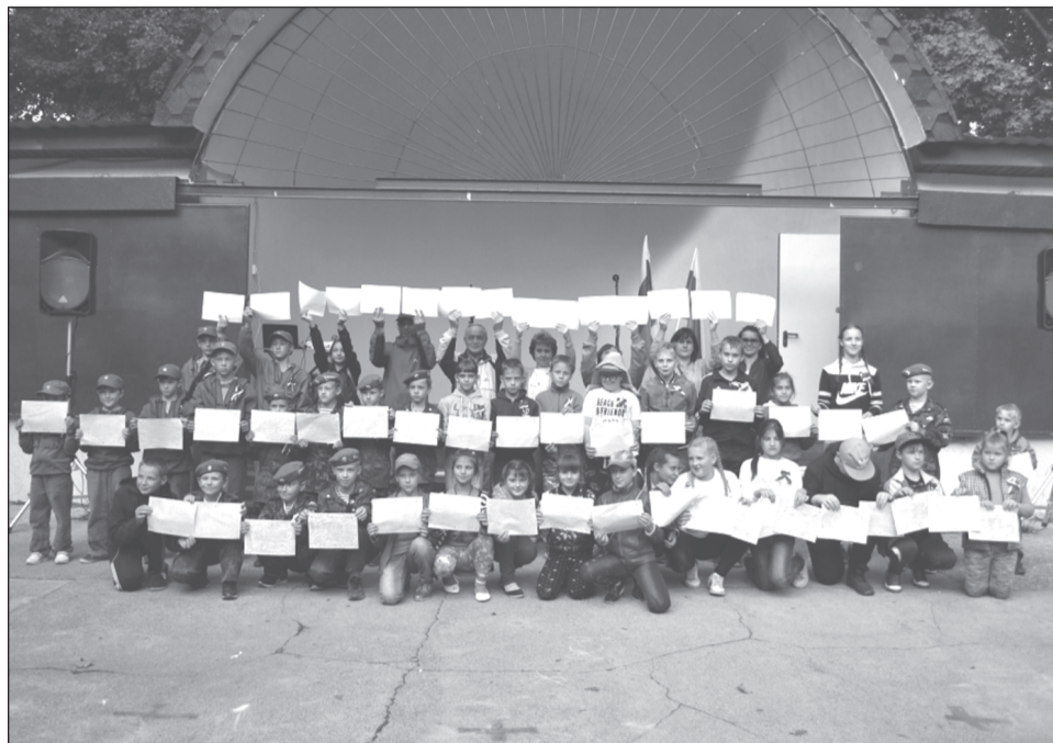
Вот такой флаг получился у участников квест игры.

День Государственного флага Российской Федерации, ежегодно отмечаемый 22 августа, не является выходным в нашей стране, но это обстоятельство не мешает проведению в городах и сёлах различных мероприятий патриотической направленности, таких как торжественные шествия, пропагандистские акции, молодежные флешмобы, военно-спортивные игры и др. Их главная