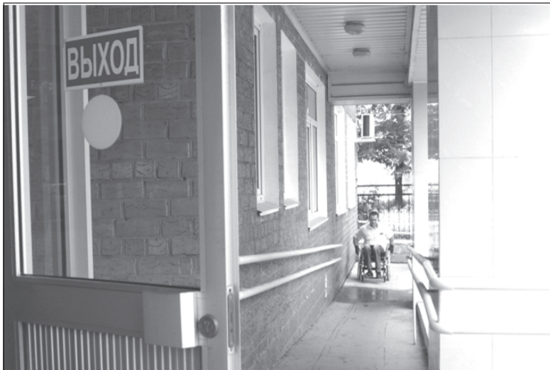
Входные площадки зданий оборудуют пандусами и поручнями.

Для обеспечения беспрепятственного доступа к объектам и услугам ПФР ведется работа по оснащению клиентских служб специальными приспособлениями и оборудованием.