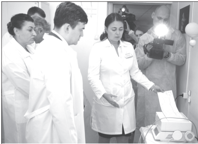
Знакомство с материально-технической базой медучреждения.

В ходе рабочей поездки временно исполняющий обязанности губернатора Ивановской области Станислав Воскресенский ознакомился с материально-технической базой ряда медучреждений города Иванова и посетил работу нового оборудования, а также обсудил с медиками областного центра актуальные вопросы развития здравоохранения региона.