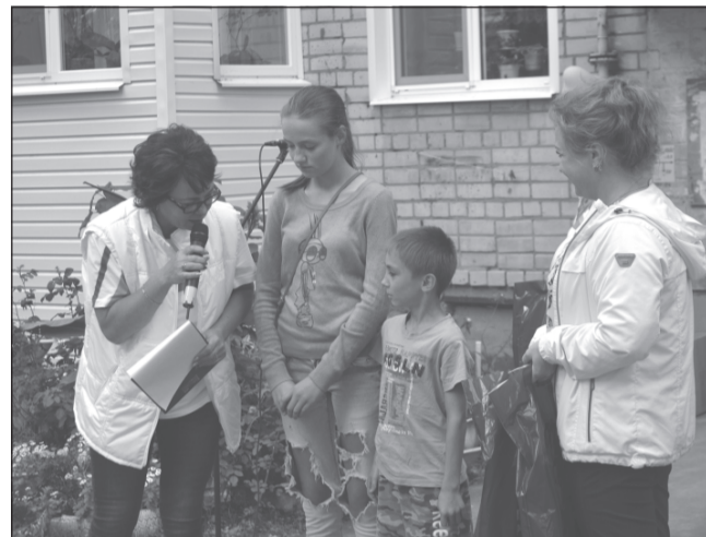
Соберем детей в школу.

Не зря тут и Дни двора проходят часто и с успехом. Вот и на минувшей неделе у дома № 18 состоялся подобный праздник. Судя по лицам пришедших на это мероприятие, им нравится такое внимание со стороны организаторов. Разве плохо, когда во дворе дома звучит музыка, хорошие песни, для детей проводится игровая программа, за участие в которой ещё и призы получить можно? Мало того, двор в этот день приобретает дополнительные краски - то тут, то там - где на цветах, где - на дереве, где у подъезда появляются нарядные воздушные шары - настроение, хо-