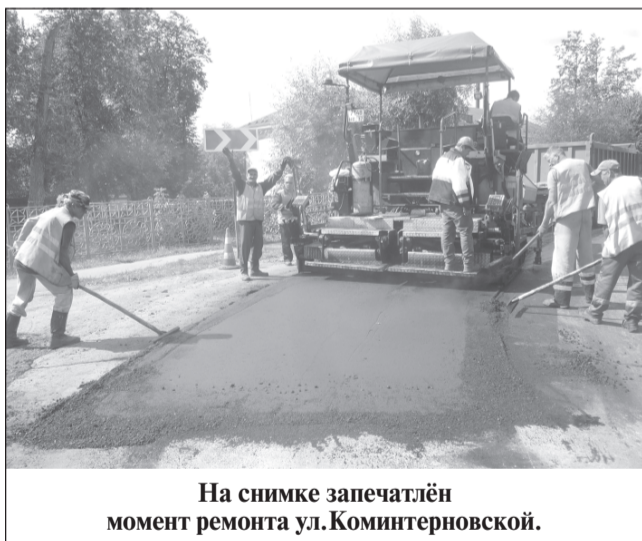
На снимке запечатлён момент ремонта ул. Коминтерновской.

Следующей точкой отсчета работников Ивановской дорожной службы стала трасса по ул. Ленина. Много нареканий у приволжан вызывала дорога на ул. Революционной в сторону Василева. Ранее она была отремонтирована по, так называемой, новой технологии со снятием верхнего слоя щебеночного и булыжного покрытия, однако ноу-хау себя не оправдало. Сейчас трасса вновь подверглась ре-