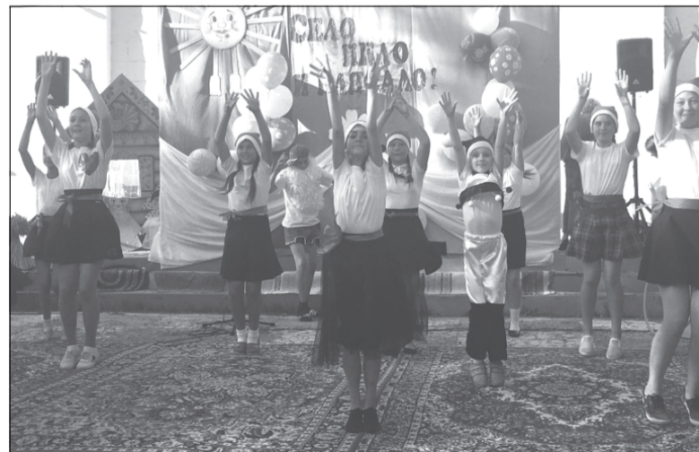
Выступление ребят из культурно-досугового центра - лучший подарок для гостей.

Настоящим подарком для жителей от ООО «Родник» стало вы-