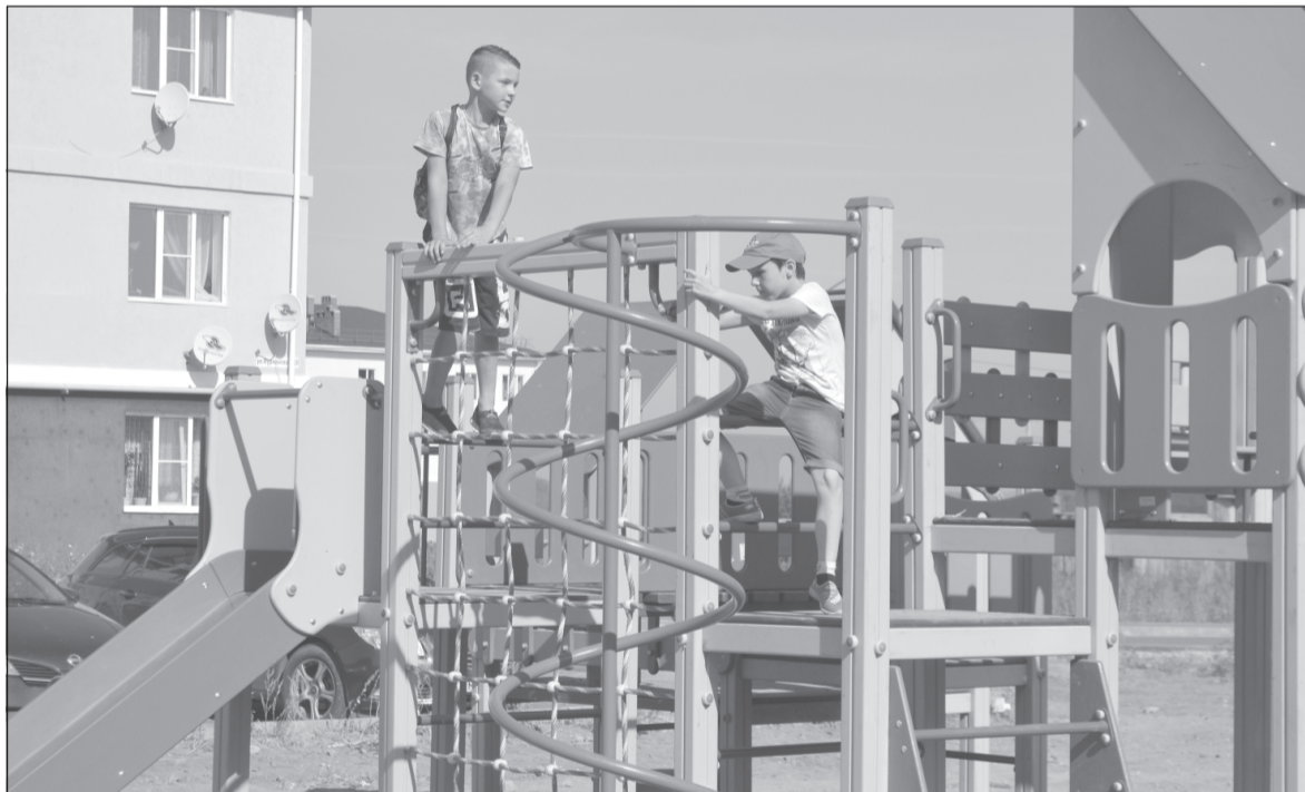
Новая спортплощадка на ул. Фурманова - подарок детям.